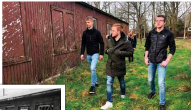
Boven: studenten van het Alfa-college bij de restanten van Barak Linde. Links: Eén van de zeer weinige foto's van het complex tijdens de oorlogsjaren.